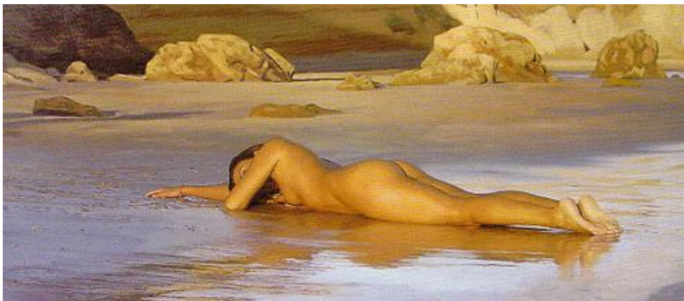
(Guennadi Ulibin, Bajamar, Oleo sobre lienzo 100×195cm)

Si Corella es diferente a la mayoría de realistas, más lo es aun Guennadi Ulibin , pintor de origen ruso afincado en Osuna ( Sevilla ), que suele presentar escenas decadentes de playas y desiertos con desnudos y restos de una civilización destruida. La calidad de sus suelos es muchas veces simplemente espectacular.